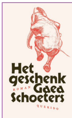
Het geschenk Gaea Schoeters Querido