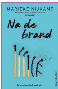
Na de brand Marieke Nijkamp Selma Soester (vert.) HarperCollins