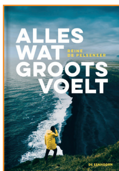
Alles wat groots voelt Reine De Pelsemeer De Eenhoorn