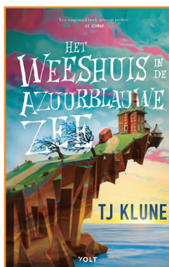
Het weeshuis in de azuurblauwe zee TJ Klune Anneke Bok (vert.) Claudia de Poorter (vert.) Volt