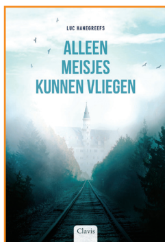
Alleen meisjes kunnen vliegen Luc Hanegreefs Clavis

Met jouw stem bepaal je mee wie de winnaars worden van de Leesjury 2024.