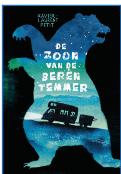
De zoon van de berentemmer

Met jouw stem bepaal je mee wie de winnaars worden van de Leesjury 2024.