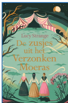
De zusjes uit het Verzonken Moeras

Lucy Strange Aleid van Eekelen-Benders (vert.)