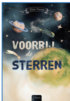
Voorbij de sterren