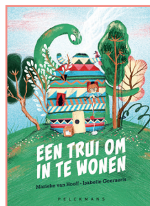
Een trui om in te wonen

Marieke van Hooff Isabelle Geeraerts (ill.)