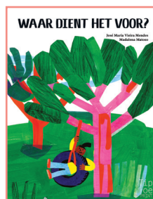
Waar dient het voor?