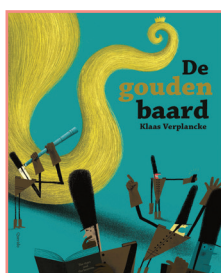
De gouden baard