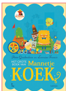
Het grote boek van Mannetje Koek

Lorraine Francis Pieter Gaudesaboos (ill.) Bette Westera (vert.)