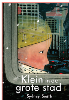
Klein in de grote stad

Sydney Smith Edward van de Vendel (vert.)